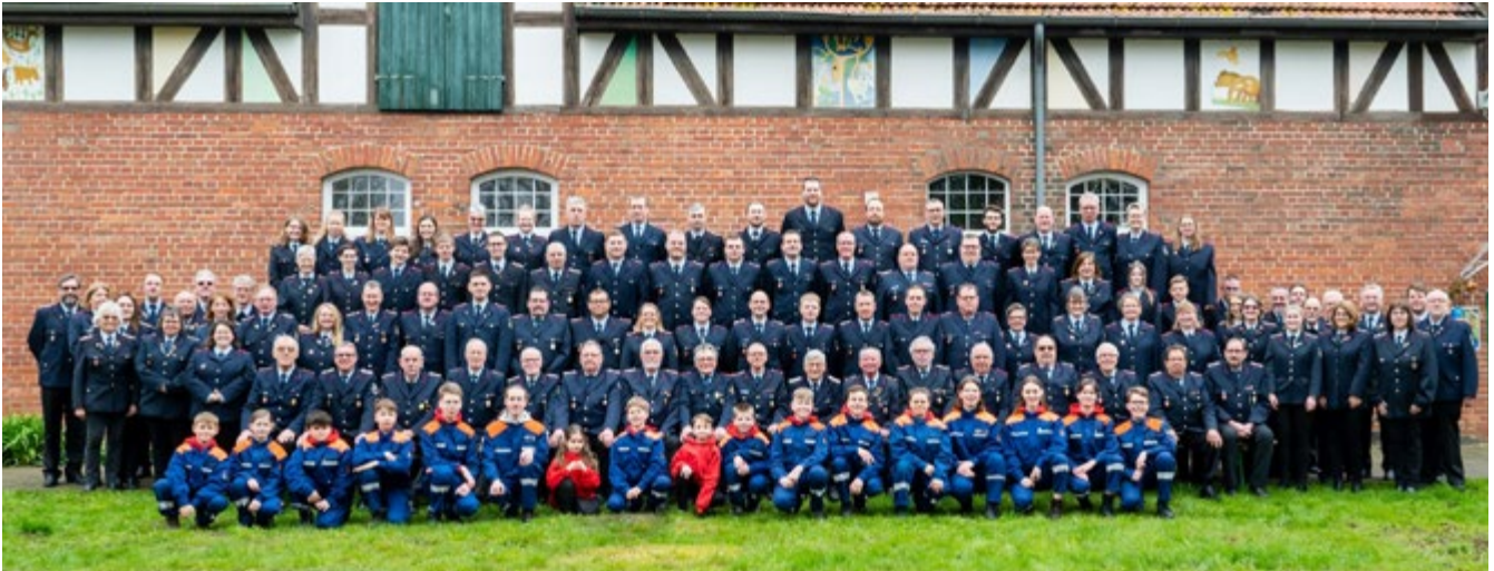
Sorsumer Feuerwehr im Jubiläumsjahr

Lange mussten die Sorsumer Feuerwehrleute warten, bis sie das 130-jährige bzw. 132-jährige Bestehen ihrer Feuerwehr feiern konnten