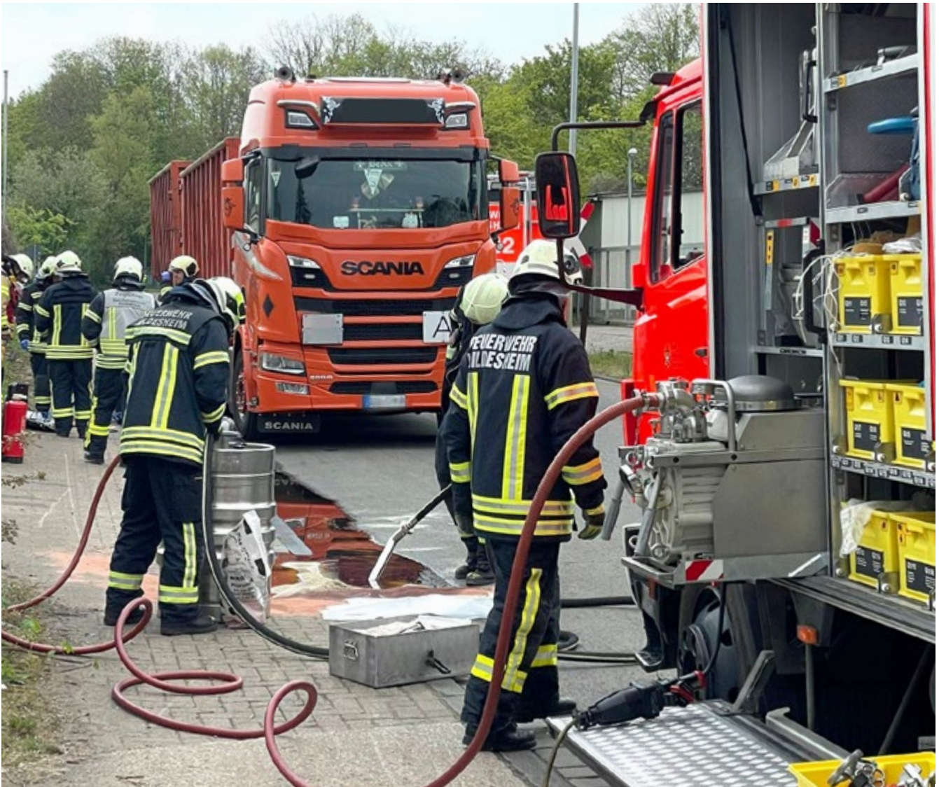
Dieselspur Hafenstraße (06.05.2023)

Die Berufsfeuerwehr ist als Fachbereich Feuerwehren und Rettungsdienst Bestandteil der Stadtverwaltung Hildesheim. Der Fachbereich ist zuständig für alle Themen des vorbeugenden und abwehrenden Brandschutzes, der Hilfeleistung, des Rettungsdienstes sowie des Bevölkerungs- und Katastrophenschutzes in der Stadt Hildesheim. Beim Fachbereich Feuerwehr und Rettungsdienst sind derzeit 136 Beamtinnen und Beamte im Feuerwehrdienst und 15 Brandmeisteranwärter in der Ausbildung beschäftigt. Unterstützt wird der Fachbereich von 13 Mitarbeitenden in verschiedenen Bereichen der Verwaltung.