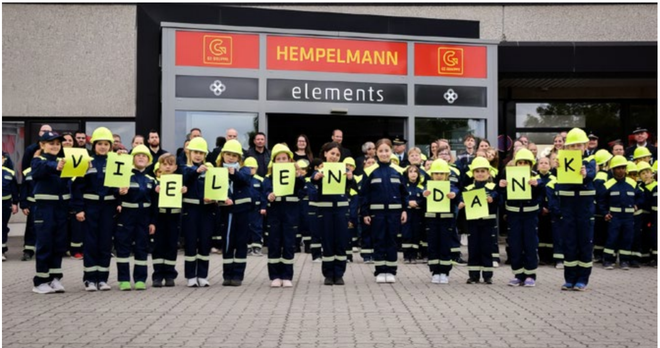
Kinderfeuerwehr bedankt sich für die neuen Uniformen

Die Kinderfeuerwehren der Stadt Hildesheim blicken auf ein erfolgreiches Jahr 2023 zurück. Die Zusammenarbeit zwischen den Kinderfeuerwehren wurde enger und zahlreiche Wünsche der jüngsten Feuerwehrmitglieder konnten dank großzügiger Unterstützer erfüllt werden. Doch was heißt das genau?