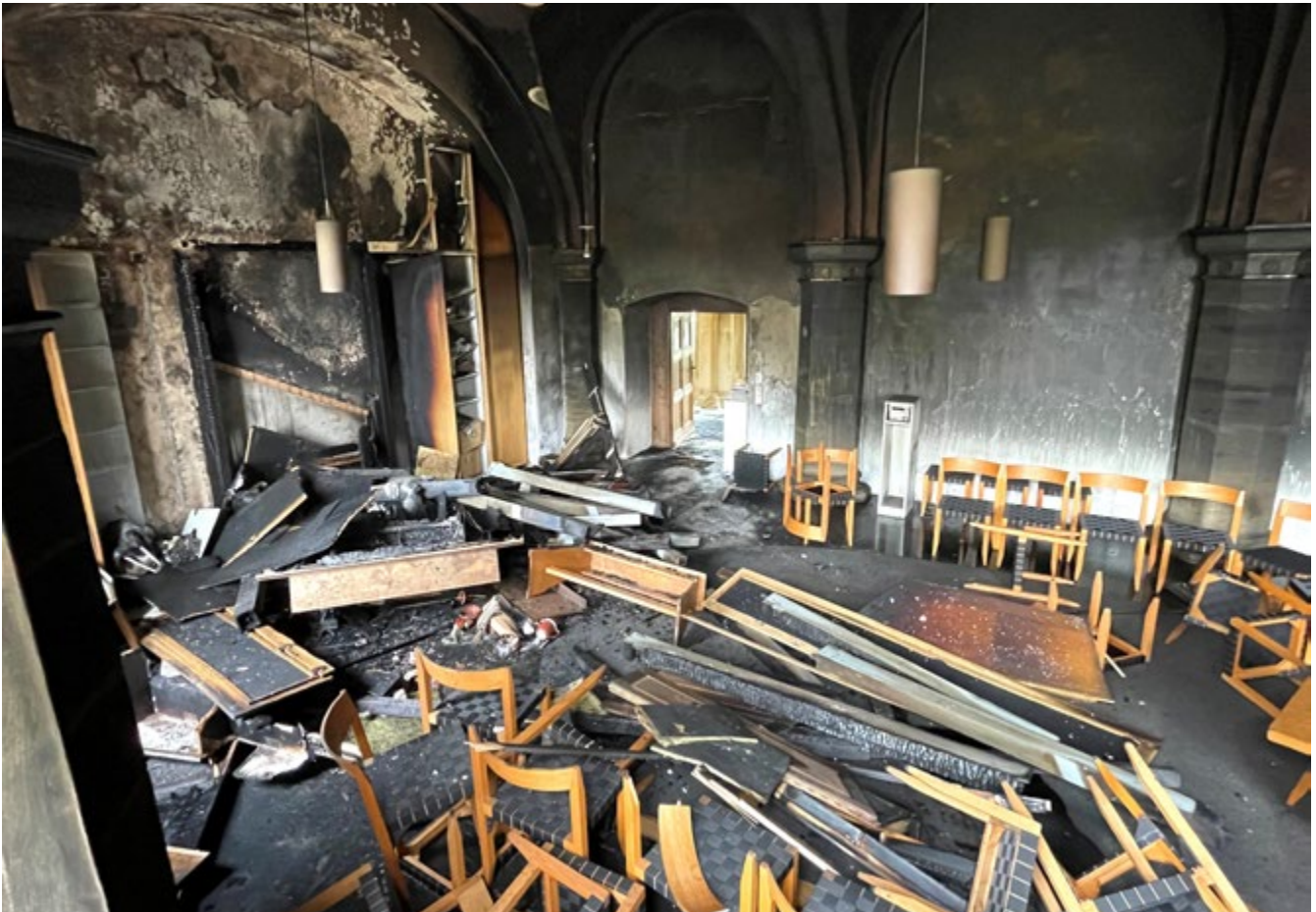
Hier wurden nach dem Löschen Brandermittler tätig.

Am 29. August 2023 um 1.32 Uhr läutete der Alarmgong in der Feuerwache am Kennedydamm. „Einsatz für den Einsatzzug Brandmeldeanlage Tagungsstätte Michaeliskloster“ tönte es durch den Lautsprecher. Eine von etwa 170 Alarmierungen durch Brandmeldeanlagen, zu denen der Einsatzzug der Berufsfeuerwehr jedes Jahr ausrückt.