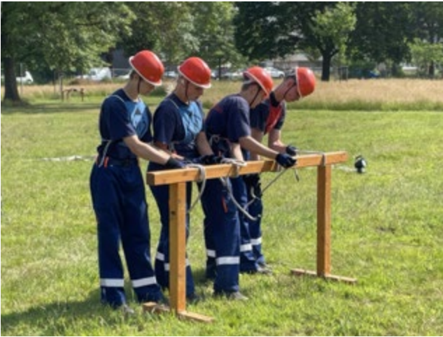
Wiederkehrende Herausforderung bei den Wettbewerben der Jugendfeuerwehr: Das Stechen verschiedener Knoten

Die Jugendfeuerwehren Hildesheims sind zurück im normalen Dienstbetrieb. Nachdem die letzten Jahre durch Covid-19 geprägt waren, bestanden 2023 keine Einschränkungen durch die Pandemie. Und es wurde festgestellt, dass altbewährte Highlights immer noch Highlights sind.