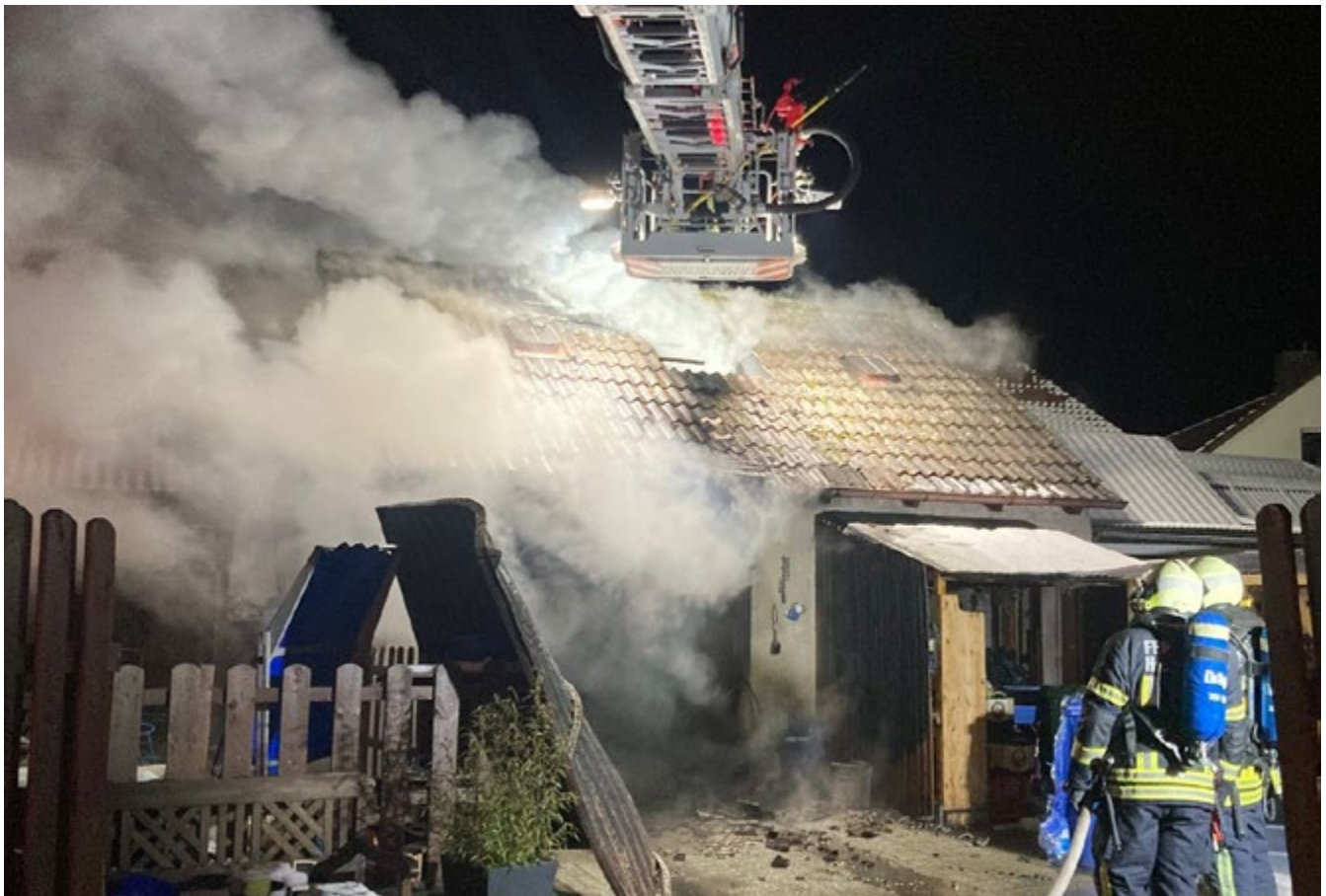
Garagenbrand Himmelsthür (12.02.2023)