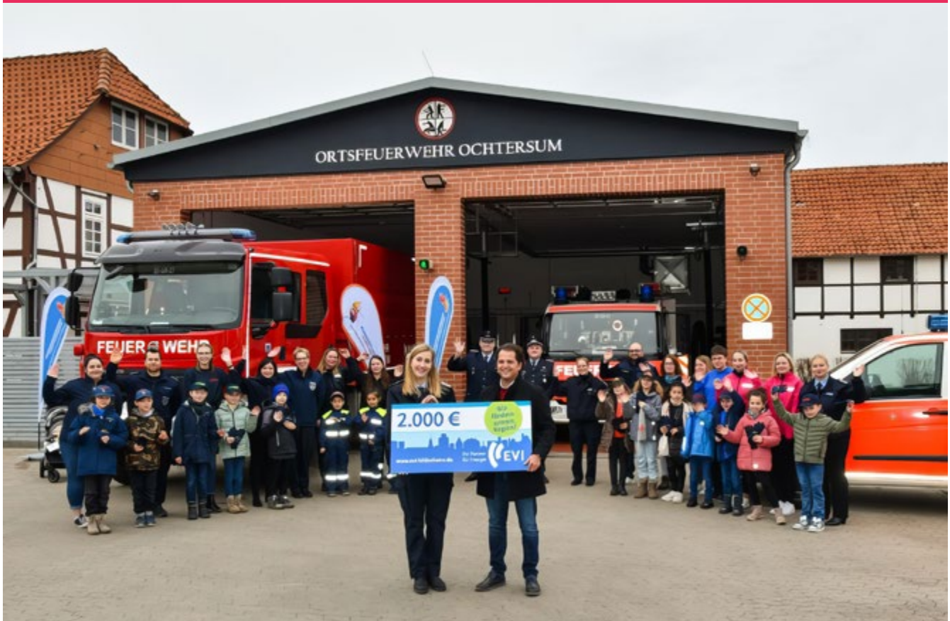
Spendenübergabe der EVI Energieversorgung Hildesheim an die Kinderfeuerwehr

Auch hierbei konnten die Kinderaugen in diesem Jahr zum Leuchten gebracht werden.