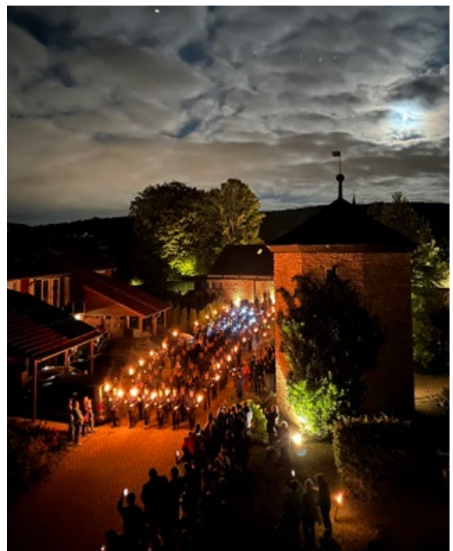
Zapfenstreich in Sorsum

Zum Start in den Sonntag wurde ein Gottesdienst mit einem anschließenden Frühstück im Festzelt begangen, bevor am Mittag mit dem Festumzug der letzte große Programmpunkt eingeläutet wurde. Knapp 50 Gruppen, bestehend aus diversen Feuerwehren des Stadtgebietes und dem Umkreis sowie zahlreiche Vereine und Gruppierungen aus dem Ortsteil, hatten sich zum Umzug angemeldet. Entsprechend groß war der Trubel rund um den Festplatz und den Aufstellungsraum des Festumzugs. Bei strahlendem Sonnenschein und bejubelt von zahlreichen Zuschauern setzte sich dann am frühen Nachmittag der Umzug durch den bunt geschmückten Ortsteil in Bewegung. Nach der Rückkehr zum Festplatz wurde im Zelt wiederum bis in die Nacht weitergefeiert.